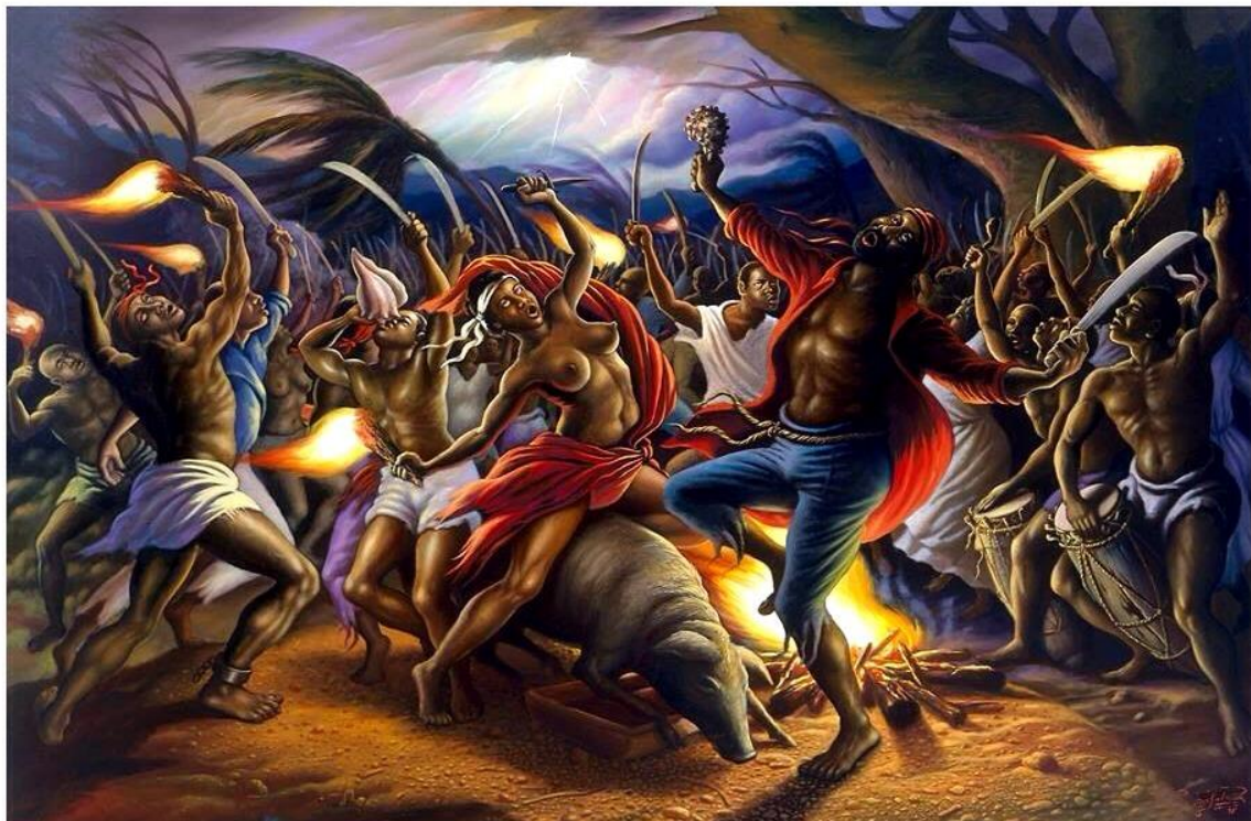
Figura II. Pintura de Ulrick Jean-Pierre.

Por último, a respeito desta instigante obra de Buck-Morss penso ser uma pena que a autora tenha citado a questão do Vodu , tão-somente, duas vezes no decorrer do seu texto. A própria filósofa diz que a relação entre Hegel e Haiti deveria ser melhor desenvolvida, contudo, creio que esta relação poderia tomar outras formas não apenas regressando os exemplares de Minerva , mas, também, analisando a cultura haitiana e, principalmente, o Vodu como uma cosmopolítica. Tal