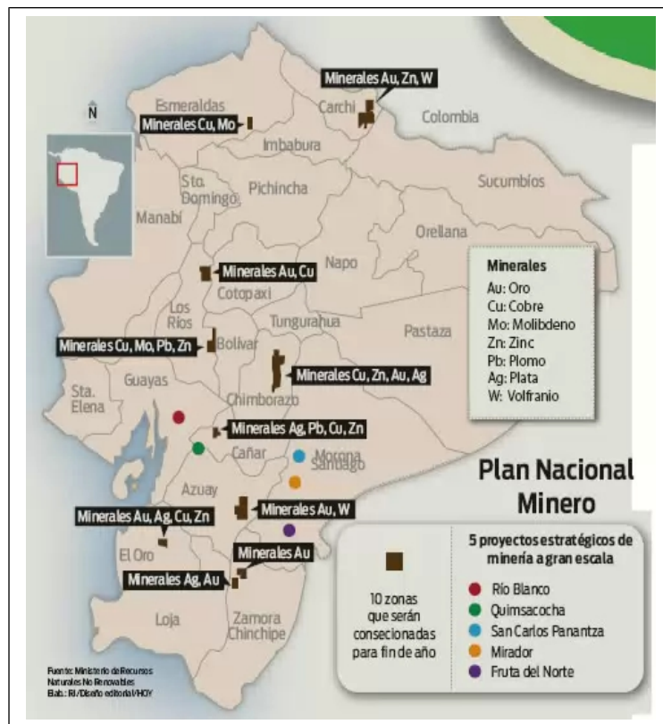
Mapa 1: Proyectos mineros en Ecuador