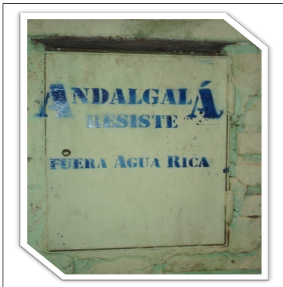
Graffiti en la ciudad de Andalgalá, Catamarca, Argentina. mayo de 2010