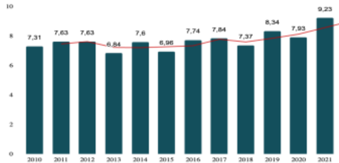
Gráfico 2 - ODS - Objetivo 2 - Proporción de nacidos vivos con bajo peso al nacer (%)

En el gráfico 2 se aprecia la proporción de nacidos vivos con bajo peso al nacer entre 2010 y 2021. Se refiere a los nacidos vivos con menos de 2.500 gramos del total en el mismo periodo, según el lugar de residencia de la madre (IPARDES, 2023).